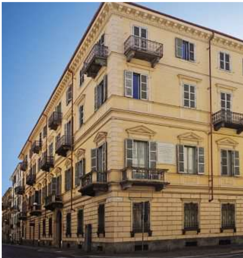
Ex Toro Assicurazioni Maria Vittoria 18 è la prima palazzina di Torino che si affitta con un click

Il palazzo di via Maria Vittoria era sede di uffici, da tempo di proprietà di compagnie assicurative: prima Toro Assicurazioni, ora Vittoria, che ne ha affidato la gestione a Morning Capital, società di finanza immobiliare partecipata da Vittoria Assicurazioni con all'attivo diversi interventi importanti, soprattutto a Milano, Torino e Genova. L'elemento di maggiore novità, però, non risiede nella conformazione degli appartamenti o nei loro allestimenti, ma nella modalità innovativa con cui possono essere scelti, personalizzati fino al minimo dettaglio e affittati con una procedura completamente digitale. Die-